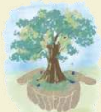
Illusztráció: Hegymegi Eszter

Forrás: Hétfári Andrea: Égbe szálló gyermekimák