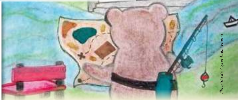
Illusztráció: Gyombolai Emma

Ha a medvémmel útra kelek, kutyagolok, sőt medvegelek, amíg el nem érünk Vácra. Vácon aztán nincs más hátra, alaposan szétnézünk, hiszen van jó térképünk. Ha úgy hozza a medve kedve, zöld fűben leheveredve, folyóparton megpihenünk, elővesszük eledelünk. Füzes parton pecázunk, reméljük lesz kapásunk. Amikor majd hazamegyünk, jó, hogy újra otthon leszünk. S ha azt kéred, hogy meséljek, neked valami medvéset, elmesélem sorra, rendre, merre jártunk én s a medve. Mutatok pár szép képet, folyópartit, medvéset. Legközelebb együtt megyünk, medvegelhetsz te is velünk.